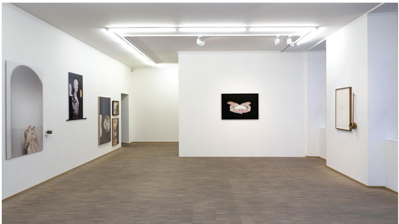
Exhibition view, Nathanaëlle Herbelin Nosbaum Reding, Luxembourg projects, 2021