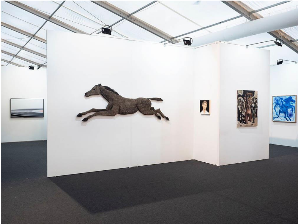
Luxembourg Art Week 2021 : Nosbaum Reding gallery